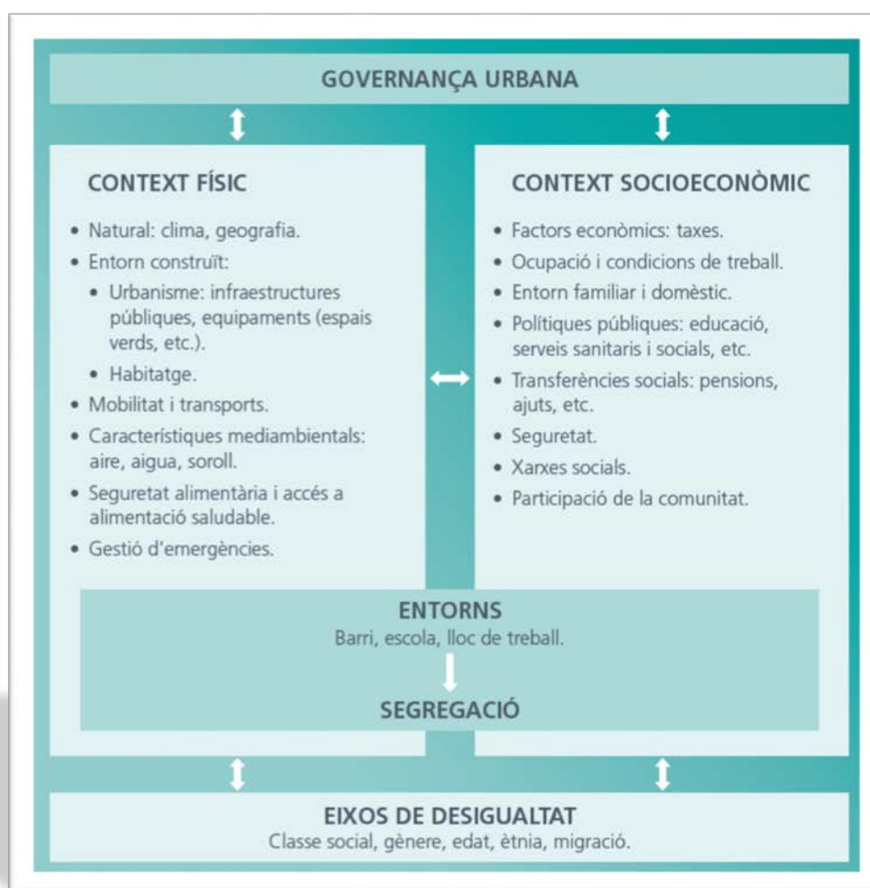
Figura 1. Determinants de la salut a nivell urbà.